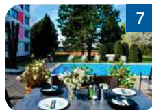
7 Ibis Styles Linz Wankmüllerhofstraße 37 4020 Linz www.ibis-styles-linz.meinhotel.top