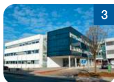
3 Techno-Z Ried Technologiezentrum GmbH Molkereistraße 4 4910 Ried im Innkreis www.tzr.at