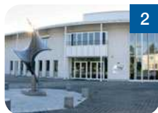
2 Kultur- und Sportzentrum Hörsching Humerstraße 20 4063 Hörsching www.kusz.at