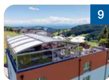
9 Hotel Alpenblick Rohrach 8 4202 Kirchschlag bei Linz www.hotelalpenblick.at