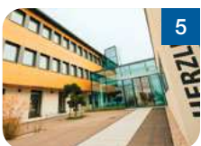
5 Bildungshaus St. Magdalena Schatzweg 177 4040 Linz www.sanktmagdalena.at