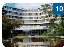
10 Seminarhaus auf der Gugl Auf der Gugl 3 4021 Linz www.seminarhaus-gugl.at