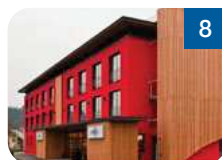
8 Hotel Garni Welserstraße 18 4702 Wallern an der Trattnach www.hotelwallern.at