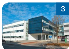
3 Techno-Z Ried Technologiezentrum GmbH Molkereistraße 4 4910 Ried im Innkreis www.tzr.at