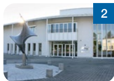
2 Kultur- und Sportzentrum Hörsching Humerstraße 20 4063 Hörsching www.kusz.at