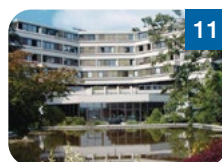
11 Seminarhaus auf der Gugl Auf der Gugl 3 4021 Linz www.seminarhaus-gugl.at